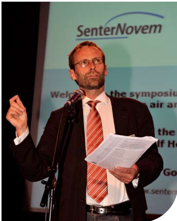
Prof. Sybrand van der Zwaag, voorzitter IOP SHM

Twee jaar geleden was er nog niets. Nu lopen er 28 onderzoeksprojecten op het gebied van self healing materials. Twaalf daarvan zijn al enige tijd gaande, zestien andere staan in de startblokken. Op 23 oktober werden alle projecten gepresenteerd tijdens het IOP Self Healing Materials symposium 'In the air and climbing fast' in de Goudse Schouwburg.