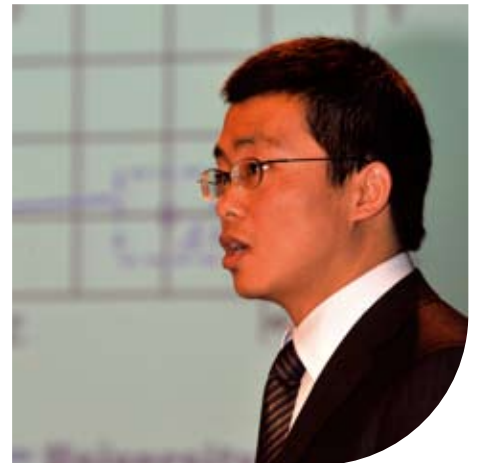
Dr. J. Song van de oppervlakte- en tribologiegroep van de TU Twente

Een volledig keramische verbrandingsmotor, zoals ooit de bedoeling was, is een utopie, meent Dik. “Het is wel geprobeerd. Maar dat apparaat maakte een pokkeherrie! Logisch, want normaliter gebruikt men in een verbrandingsmotor olie als smeermiddel, en dat zorgt meteen voor ‘damping’ in het systeem. Dat is het gekke van wetenschappelijk onderzoek. In